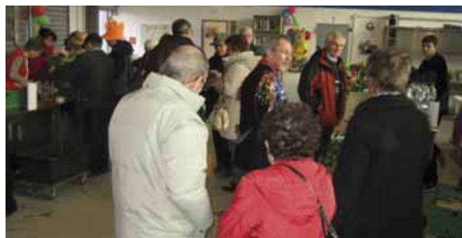
Interessierte Besucher und beschäftigte Mitarbeiter.